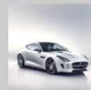
JAGUAR F-TYPE Coupé Da 69890 euro