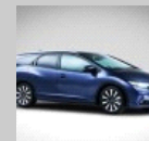
HONDA CIVIC TOURER Da 23180 euro